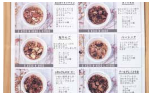
▲手作りグラノーラは10種類以上の豊富なラインナップ。

その後、北円山エリアには「カクキウェンズデイ円山店」も開店。ファンを着実に増やしています。「今後はドライフルーツも自分たちで手作りし、よりオリジナリティの高いグラノーラにして、多くの方に喜んでいただきたいと思っています」。