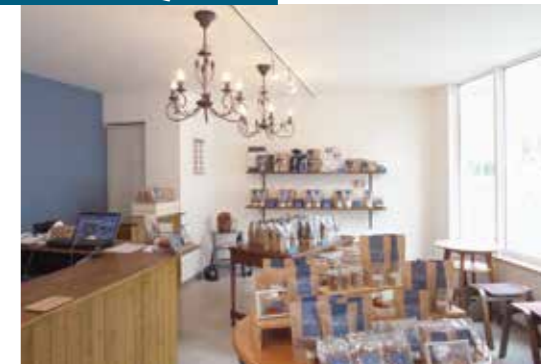
▲シンプルでもセンスの光る店内は、大好きなキーカラーで統一されています。

「会社員しかやったことがなかったので、創業しようと思っても何から始めればいいのか全然わからず、一歩を踏み出せないでいたんです」。ある日、行きつけの美容室で「グラノーラ専門店をやりたいと思っている」と話をしたところ、美容室創業時の北海道信用金庫の担当者を紹介してもらうことに。そこからさらに、中小企業支援センターを紹介してもらったといいます。「資金調達の方法、書類の書き方など、いろいろな情報を教えてもらって進めていきました」。